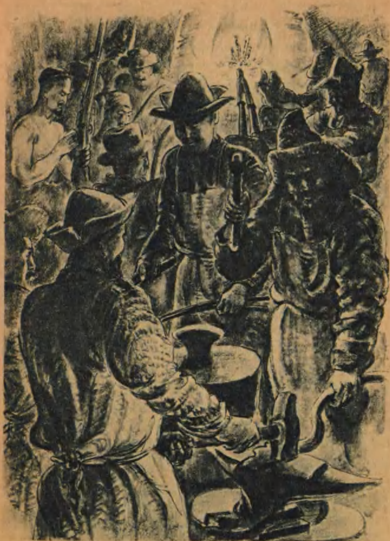
В лагерях были построены кузницы, где ковалось оружие.

НАУЧНАЯ БИБЛИОТЕКА ДОМА ДЕТСКОЙ КНИГИ ДЕТГИЗА