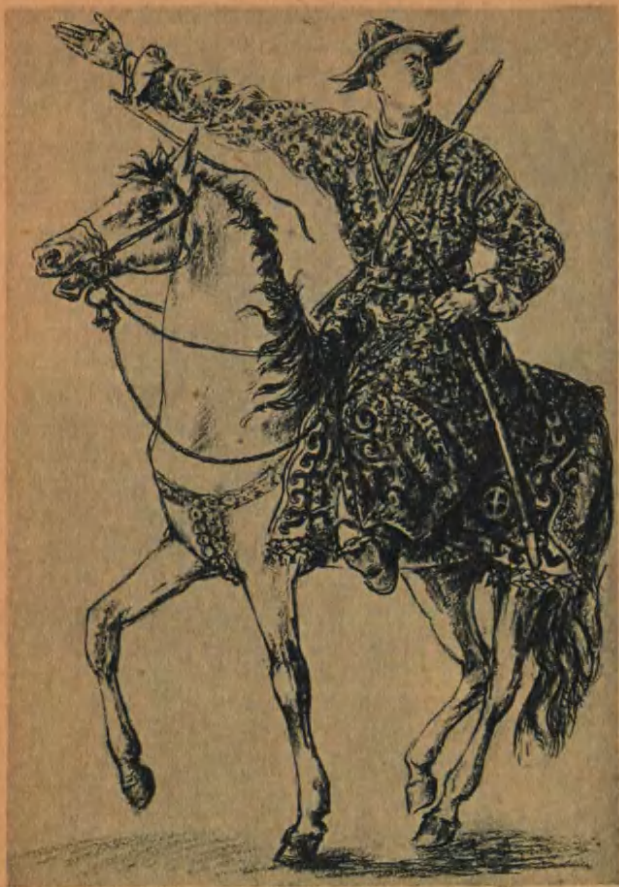
Амангельды скакал по степям, призывая к борьбе.